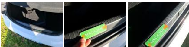
Moulure de pare-chocs AR, Déformé / Forcé, Le - Remplacer et peindre