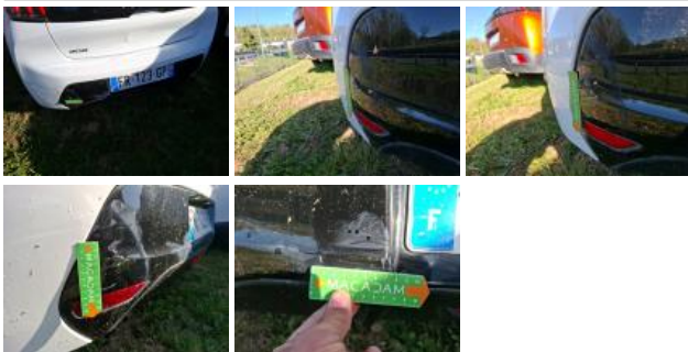
Pare-chocs AR, Griffe(s), Peindre