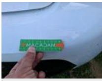
Coffre / hayon, Bosse(s), LI - Réparer et peindre (complet)