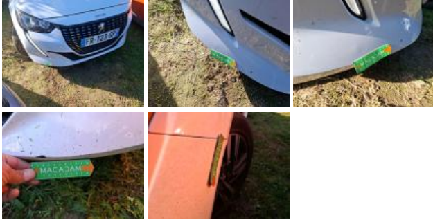
Porte ARD, Bosse(s), LI - Réparer et peindre (complet)