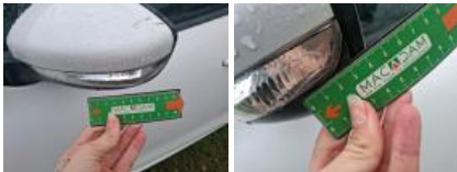
Porte AVG, Griffe(s), Lustrage