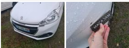
Capot, Griffe(s), Peindre