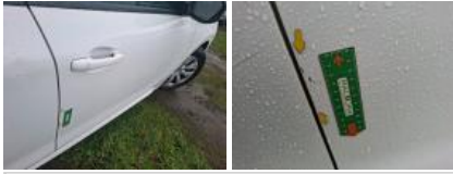
Bas de caisse ext D, Bosse(s) et griffe(s), LI - Réparer et peindre (complet)