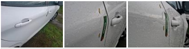
Porte AVD, Griffe(s), Peindre