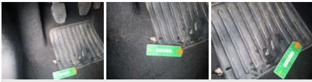
Intérieur, Tache, Nettoyer