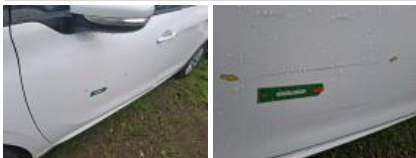
Poignée ext porte ARG, Griffe(s), Lustrage