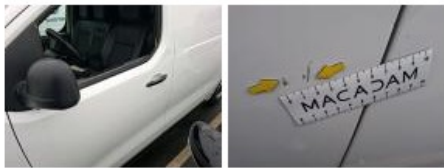
Panneau ARG, Griffe(s), Acceptable