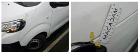
Porte AVG, Griffe(s), Acceptable