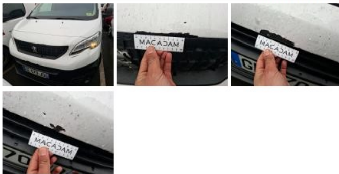
Capot, Eclat(s), Peindre