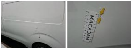
Pare-chocs AV, Griffe(s), Acceptable