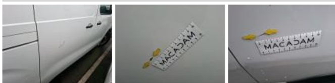
Pas de caisse ext D, Bosse(s) et griffe(s), LI - Réparer et peindre (complet)