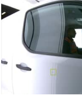
Enfoncement(s) - Superficiel