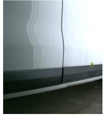
Enfoncement(s) avec peinture - Superficiel