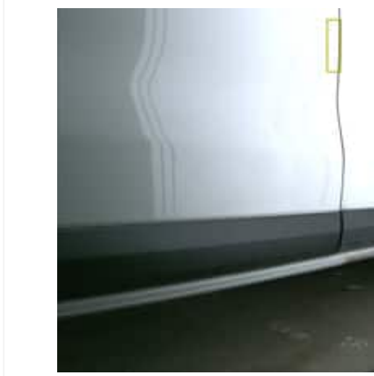
Enfoncement(s) - Superficiel