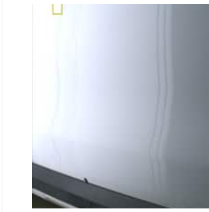
Enfoncement(s) - Superficiel