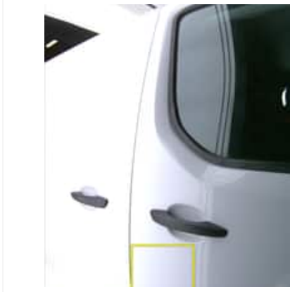
Rayure(s) - Léger / Faible