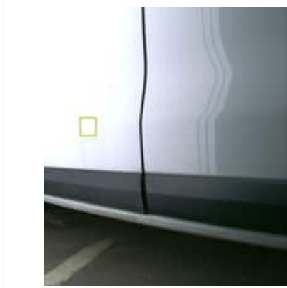
Enfoncement(s) - Superficiel