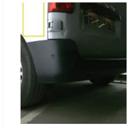
Enfoncement(s) - Léger / Faible