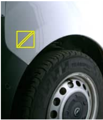
Rayure(s) - Moyen