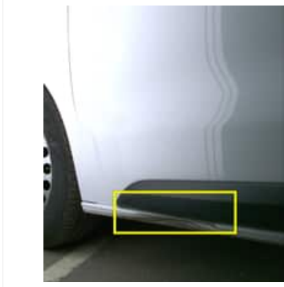
Enfoncement(s) - Moyen