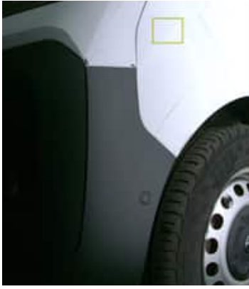
Aile Avant Gauche