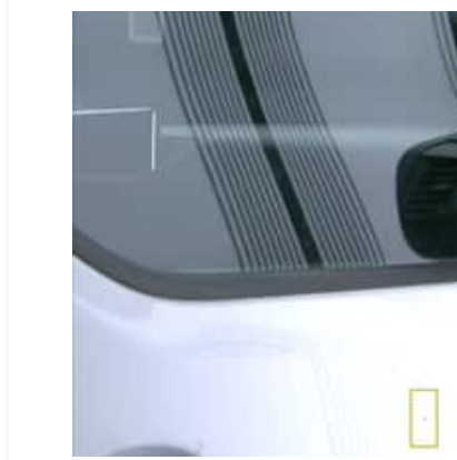
Enfoncement(s) - Superficiel