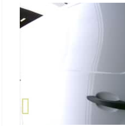
Enfoncement(s) - Léger / Faible