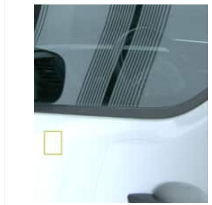
Enfoncement(s) - Superficiel