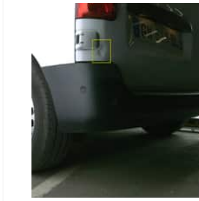
Enfoncement(s) - Léger / Faible