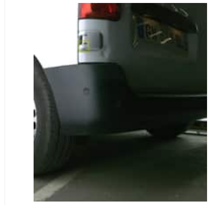
Enfoncement(s) avec peinture - Léger / Faible