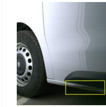
Rayure(s) - Léger / Faible