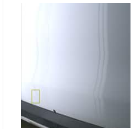
Enfoncement(s) - Léger / Faible