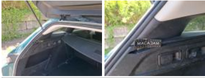
Garnit. int D coffre, Griffe(s), Réparer/rempl. (montant forfaitaire)