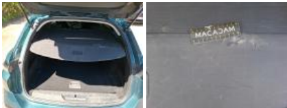
Garnit. couvercle AR, Griffe(s), Réparer/rempl. (montant forfaitaire)