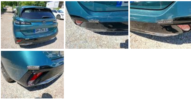
Moulure de pare-chocs ARG, Griffe(s), E - Remplacer