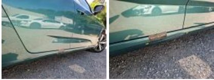
Porte ARD, Bosse(s) et griffe(s), LI - Réparer et peindre (complet)