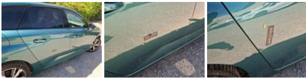
Porte AVD, Bosse(s) et griffe(s), LI - Réparer et peindre (complet)