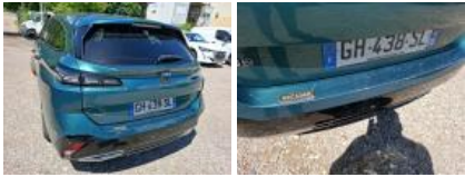
Jupe AR, Déformé / Forcé, Le - Remplacer et peindre