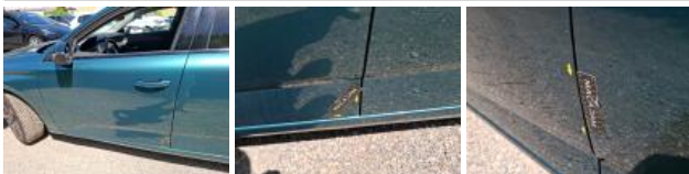
Porte ARG, Bosse(s) et griffe(s), LI - Réparer et peindre (complet)