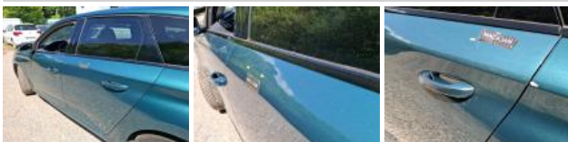
Bas de caisse ext G, Bosse(s), LI - Réparer et peindre (complet)