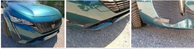
Capot, Griffe(s), Peindre