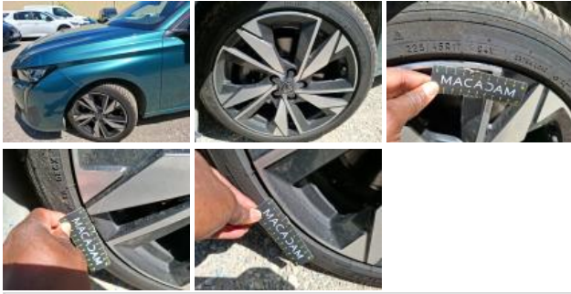
Jante alum. ARG bi-ton/polychrome, Griffe(s), Réparer/rempl. (montant forfaitaire)