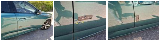
Aile AVD, Bosse(s), LI - Réparer et peindre (complet)