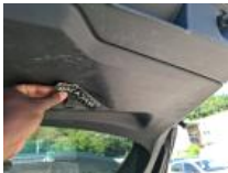
Garnit. int G coffre, Griffe(s), Réparer/rempl. (montant forfaitaire)