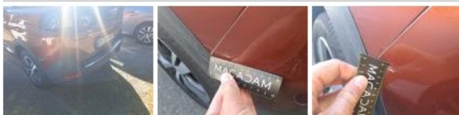
Pavillon, Griffe(s), Peindre