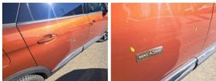
Aile AVD, Griffe(s), Lustrage