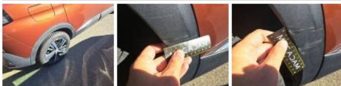
Porte ARD, Griffe(s), Peindre