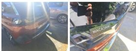
Feu ARD côté coffre, Dégrafé, Dépose/Répose