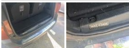
Garnit. int G coffre, Griffe(s), Acceptable