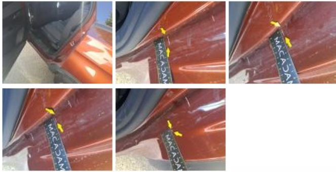
Bas de caisse int ARD, Griffe(s), Peindre