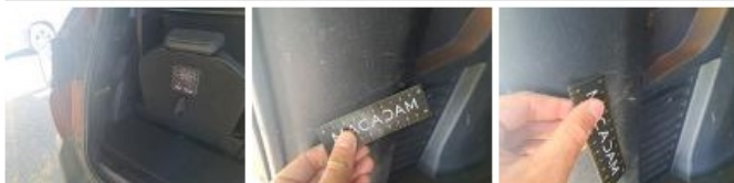
Feu ARG côté coffre, Dégrafé, Dépose/Répose