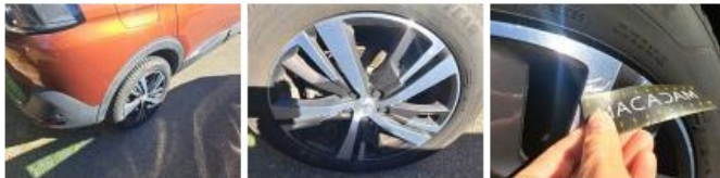
Jante alum. AVG bi-ton/polychrome, Griffe(s), Réparer/remplacer (montant forfaitaire)