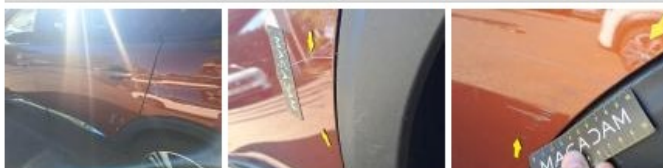
Moulure d'aile ARG, Griffe(s), Réparer/remplacer (montant forfaitaire)