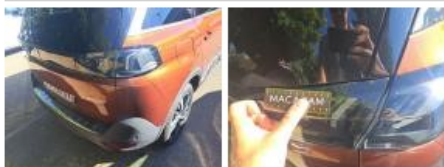
Coin pare-chocs ARG, Griffe(s), Peindre