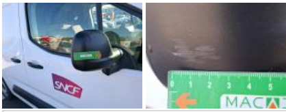
Pare-chocs AR, Déformé / Forcé, E - Remplacer