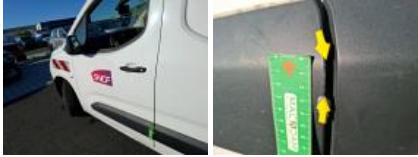
Moulure de panneau latéral G, Griffe(s), Réparer/rempl. (montant forfaitaire)