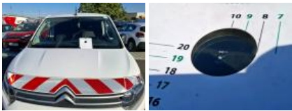
Pare-chocs AV, Griffe(s), Lustrage