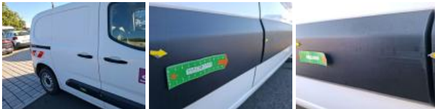
Moulure porte AVD, Griffe(s), E - Remplacer