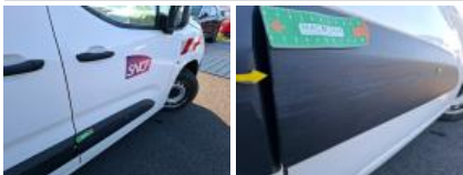
Porte AVD, Bosse(s), Acceptable