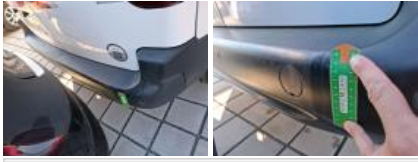
Coin pare-chocs ARD, Déformé / Forcé, Réparer/rempl. (montant forfaitaire)