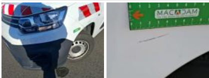
Pare-chocs AV, Griffe(s), Acceptable