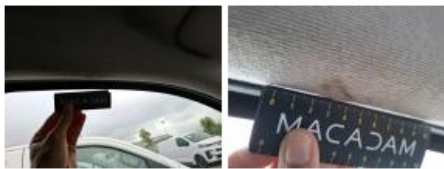
Garniture intérieur, Dégrafé, Dépose/Répose