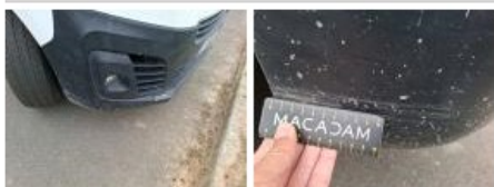
Pare-chocs AR, Déformé / Forcé, Réparer/rempl. (montant forfaitaire)