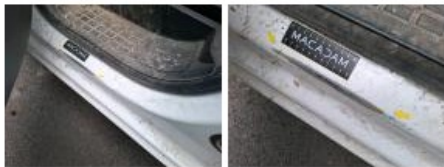
Porte AVG, Bosse(s) et griffe(s), LI - Réparer et peindre (complet)