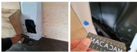
Bas de caisse int AVG, Griffe(s), Peindre