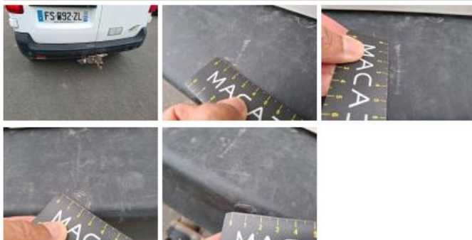
Garniture porte de malle ARD, Griffe(s), E - Remplacer