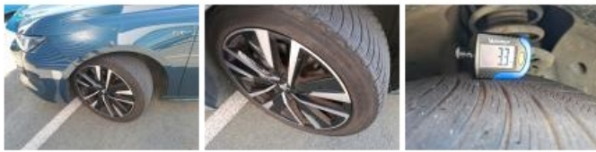
Jante alum. AVG bi-ton/polychrome, Griffe(s), Réparer/remplacer (montant forfaitaire)