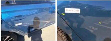
Porte AVD, Griffe(s), Acceptable