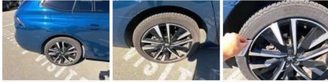
Pneu AVG, Hors tolérance, E - Remplacer