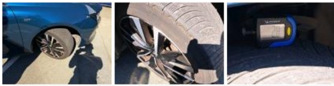
Jante alum. AVD bi-ton/polychrome, Griffe(s), Réparer/remplacer (montant forfaitaire)