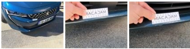
Aile ARD, Griffe(s), Peindre