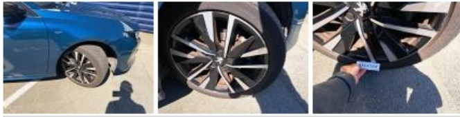
Jante alum. ARD bi-ton/polychrome, Griffe(s), Réparer/remplacer (montant forfaitaire)