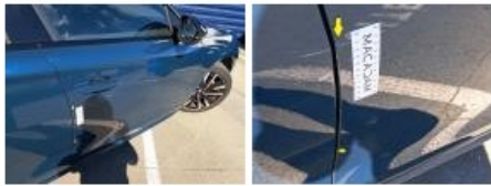
Boitier rétroviseur ext D, Griffe(s), Lustrage