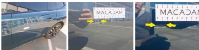
Poignée ext porte ARG, Griffe(s), Lustrage