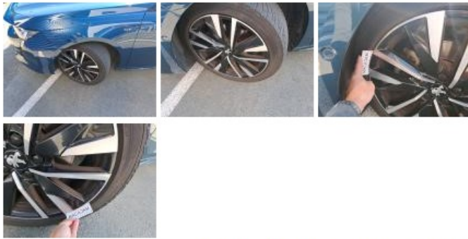
Jante alum. ARG bi-ton/polychrome, Griffe(s), Réparer/remplacer (montant forfaitaire)