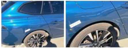
Porte ARD, Griffe(s), Lustrage