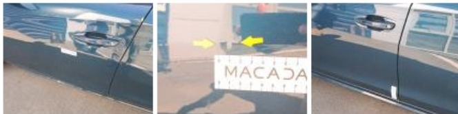
Porte ARG, Bosse(s), Acceptable