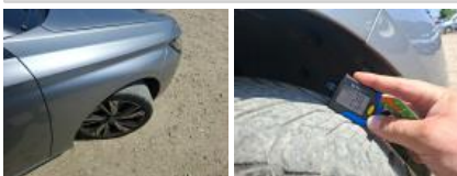
Jante alum. AVD bi-ton/polychrome, Griffe(s), Réparer/rempl. (montant forfaitaire)