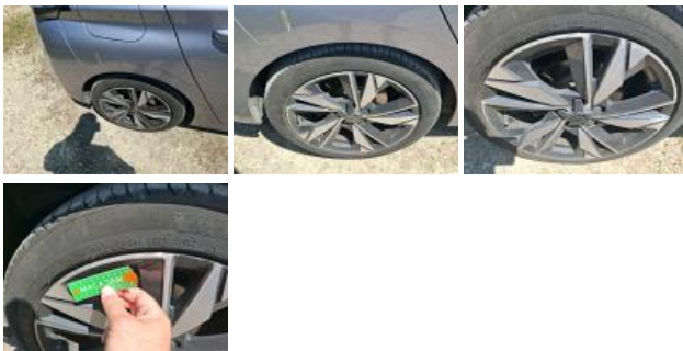
Pneu ARD, Hors tolérance, E - Remplacer