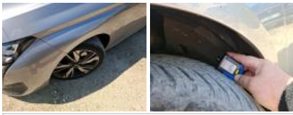
Jante alum. AVG bi-ton/polychrome, Griffe(s), Acceptable