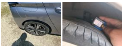
Pneu AVD, Hors tolérance, E - Remplacer