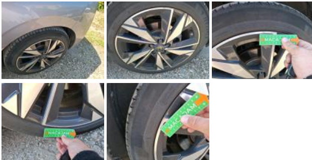
Jante alum. ARD bi-ton/polychrome, Griffe(s), Réparer/rempl. (montant forfaitaire)