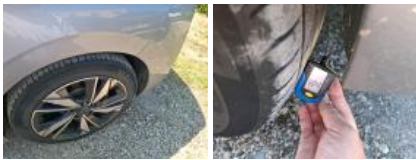
Jante alum. ARG bi-ton/polychrome, Griffe(s), Réparer/rempl. (montant forfaitaire)