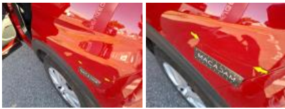
Porte AVG, Griffe(s), Acceptable