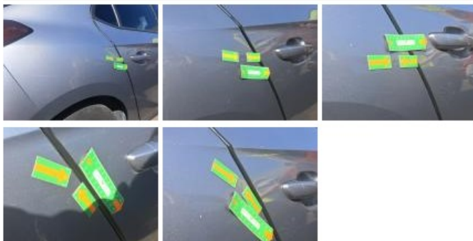
Porte ARD, Bosse(s) et griffe(s), LI - Réparer et peindre (complet)