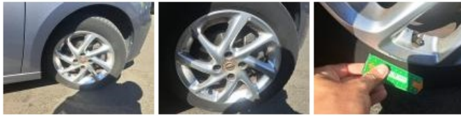
Jante alum. AVG, Griffe(s), Acceptable