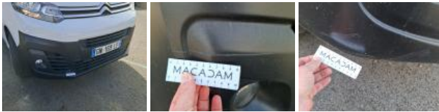
Panneau ARD, Mauvaise réparation, LI - Réparer et peindre (complet)