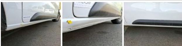
Plancher AR, Rouille, Peindre