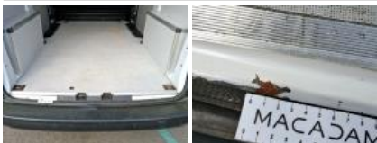
Pare-chocs AR, Cassé, E - Remplacer