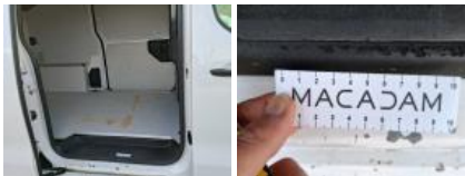
Bas de caisse int ARG, Bosse(s) et griffe(s), LI - Réparer et peindre (complet)