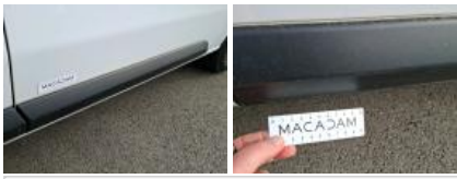
Bas de caisse ext G, Griffe(s), Peindre