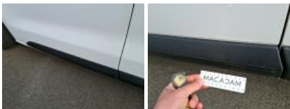
Moulure porte ARG, Griffe(s), Acceptable