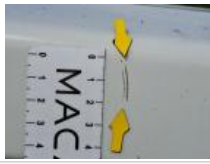
Garnit. zone de chargement, Griffe(s), Réparer/rempl. (montant forfaitaire)