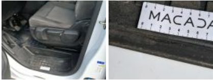
Bas de caisse int AVG, Griffe(s), Peindre