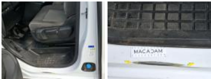
Bas de caisse int ARD, Bosse(s) et griffe(s), LI - Réparer et peindre (complet)