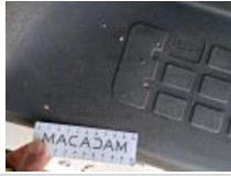
Garnit. zone de chargement, Griffe(s), Acceptable