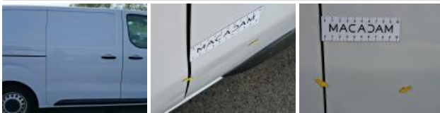
Bas de caisse ext D, Bosse(s) et griffe(s), Le - Remplacer et peindre