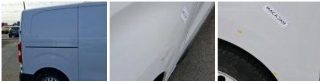
Porte coulissante D, Mauvaise réparation, LI - Réparer et peindre (complet)