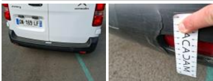
Porte de malle AR D, Griffe(s), Acceptable