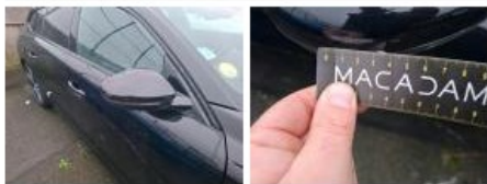
Aile AVD, Eclat(s), Acceptable