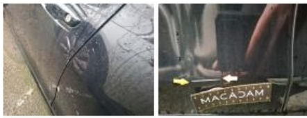
Aile ARG, Bosse(s) et griffe(s), Acceptable