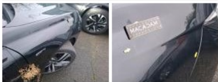
Pare-chocs AR, Griffe(s), Peindre