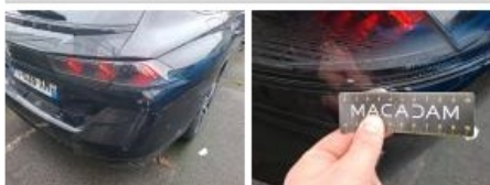
Coffre / hayon, Griffe(s), Acceptable