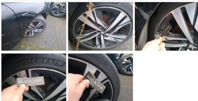
Pneu AVD, Hors tolérance, E - Remplacer