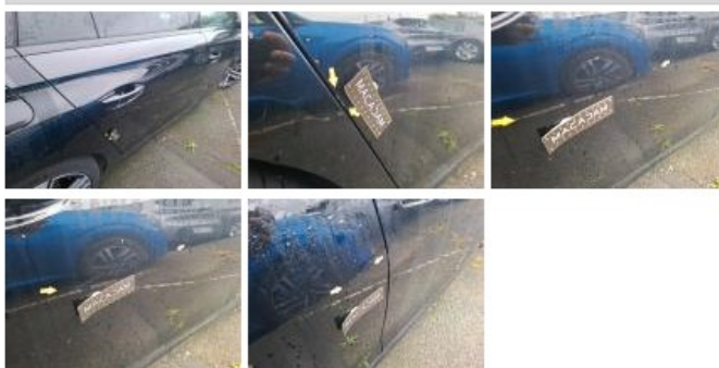
Porte AVD, Griffe(s), Acceptable