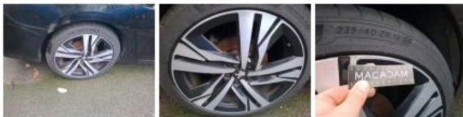
Jante alum. AVD bi-ton/polychrome, Griffe(s), Réparer/rempl. (montant forfaitaire)