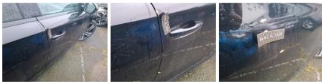
Poignée ext porte ARD, Griffe(s), Lustrage