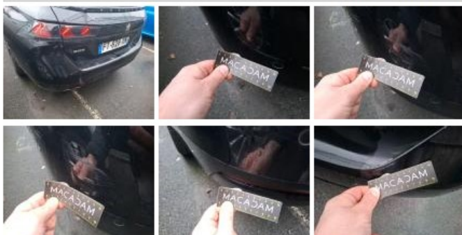
Feu ARD, Griffe(s), Acceptable