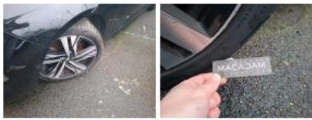
Jante alum. AVG bi-ton/polychrome, Griffe(s), Réparer/rempl. (montant forfaitaire)