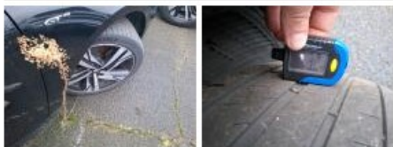
Aile AVG, Griffe(s), Lustrage