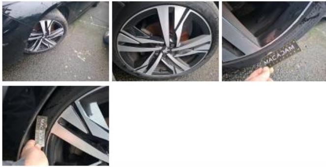
Jante alum. ARG bi-ton/polychrome, Griffe(s), Acceptable