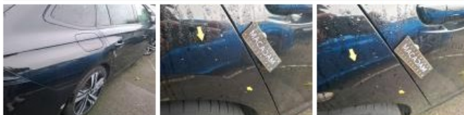
Porte ARD, Griffe(s), Acceptable