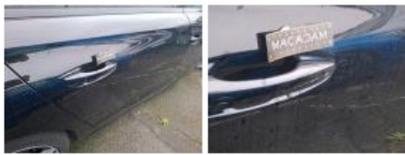
Poignée ext porte AVD, Griffe(s), Lustrage