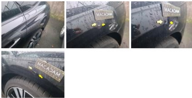
Capot, Eclat(s), Peindre