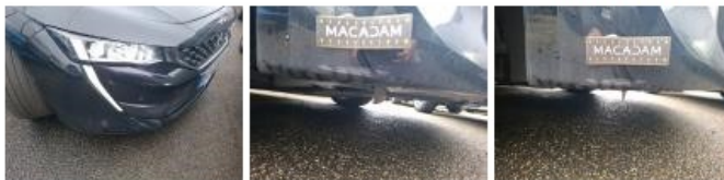
Bas de caisse ext D, Bosse(s) et griffe(s), LI - Réparer et peindre (complet)