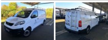
Antenne, Manque, E - Remplacer