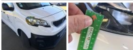
Pare-chocs AV, Déformé / Forcé, LI - Réparer et peindre (complet)