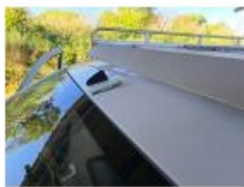
Pavillon, Bosse(s), LI - Réparer et peindre (complet)