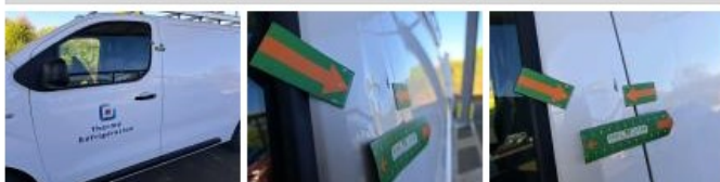
Optique AVD, Griffe(s), Lustrage