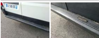
Plancher AR, Griffe(s), Peindre