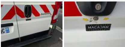
Coin pare-chocs ARD, Cassé, E - Remplacer