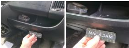
Bas de caisse int AVD, Griffe(s), Peindre