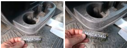
Bas de caisse int AVG, Griffe(s), Peindre