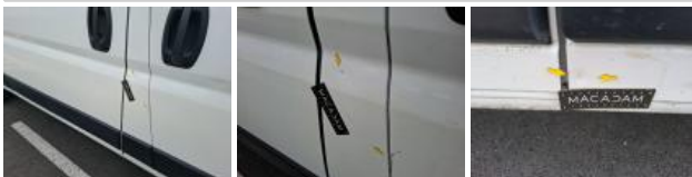
Porte de malle AR D, Trou, LI - Réparer et peindre (complet)