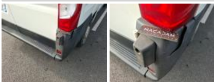
Pare-chocs AR, Déformé / Forcé, E - Remplacer