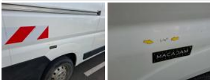
Montant milieu D, Bosse(s) et griffe(s), LI - Réparer et peindre (complet)