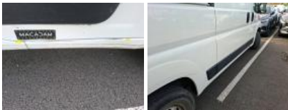
Porte coulissante D, Griffe(s), Peindre