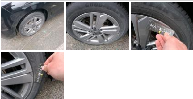
Jante alum. AVG, Griffe(s), Acceptable