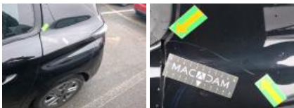
Porte AVG, Griffe(s), Peindre