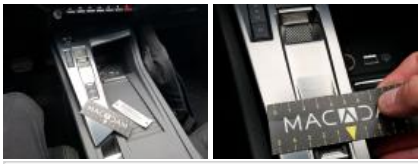
Intérieur, Tache, Nettoyer