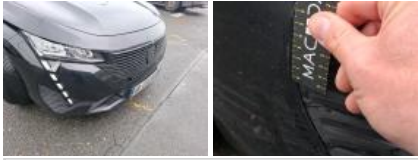
Aile AVD, Bosse(s), LI - Réparer et peindre (complet)