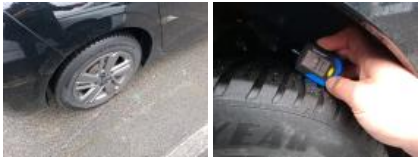
Jante alum. AVD, Griffe(s), Réparer/rempl. (montant forfaitaire)