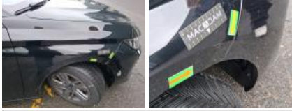
Porte AVD, Griffe(s), Acceptable