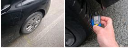
Pneu ARD, Hors tolérance, E - Remplacer