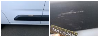
Porte AVD, Bosse(s) et griffe(s), Acceptable