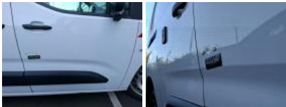
Bas de caisse ext D, Bosse(s), LI - Réparer et peindre (complet)