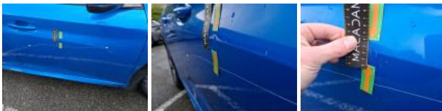
Bas de caisse ext D, Bosse(s) et griffe(s), Le - Remplacer et peindre