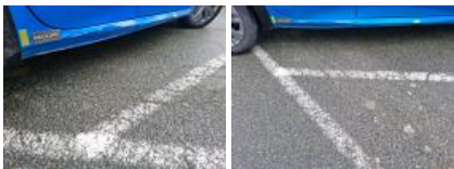
Porte ARD, Griffe(s), Peindre