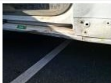
Porte AVD, Bosse(s) et griffe(s), LI - Réparer et peindre (complet)