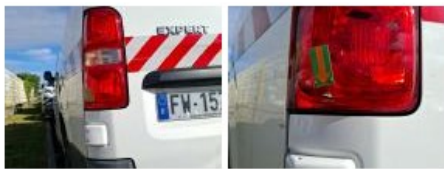
Feu ARD, Fêlure, E - Remplacer