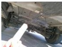
Carrosserie, Pas d'origine, Délettrage