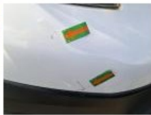
Pare-chocs AV, Griffe(s), Acceptable