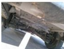
Jante de secours, Manque, E - Remplacer