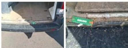
Pneu de secours, Manque, E - Remplacer