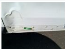
Coin pare-chocs ARG, Cassé, E - Remplacer