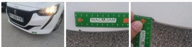
Optique AVD, Fêlure, E - Remplacer