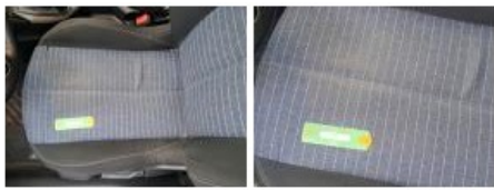
Revêtement assise siège AVD, Tache, Nettoyer