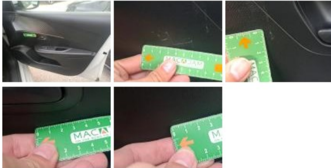
Porte AVG, Bosse(s) et griffe(s), LI - Réparer et peindre (complet)