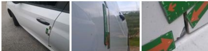
Aile ARG, Bosse(s), LI - Réparer et peindre (complet)