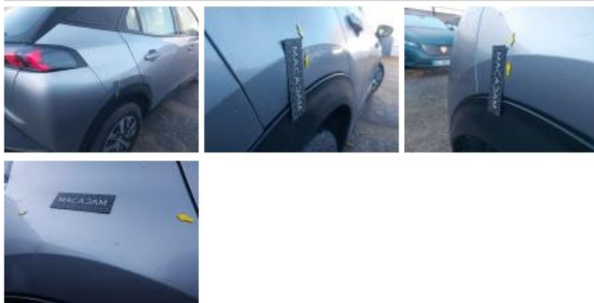
Porte ARD, Bosse(s) et griffe(s), LI - Réparer et peindre (complet)