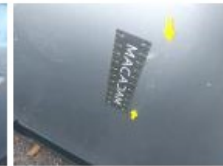
Moulure porte AVD, Griffe(s), E - Remplacer