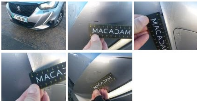
Moulure de pare-chocs AVG, Griffe(s), Acceptable