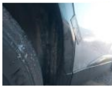
Moulure porte ARD, Griffe(s), E - Remplacer