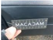
Boitier rétroviseur ext D, Griffe(s), Peindre