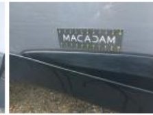
Porte AVD, Bosse(s) et griffe(s), Acceptable