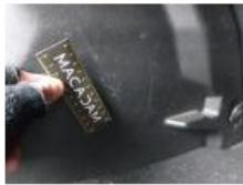
Garnit. zone de chargement, Griffe(s), Réparer/rempl. (montant forfaitaire)