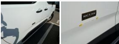
Moulure porte ARD, Griffe(s), Acceptable