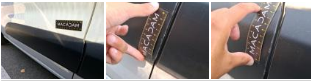
Panneau ARG, Bosse(s) et griffe(s), Acceptable