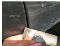
Pare-chocs AR, Griffe(s), Acceptable