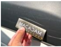
Porte AVD, Griffe(s), Peindre