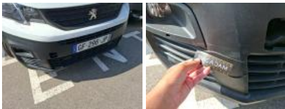
Obturbateur /Cache AV, Manque, E - Remplacer