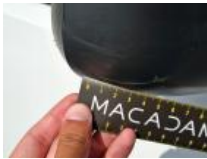
Joint de coffre/hayon, Déchirure, E - Remplacer