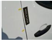
Base rétroviseur ext D, Griffe(s), Acceptable