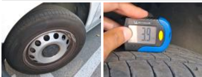
Pneu ARD, Hors tolérance, E - Remplacer