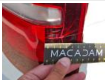
Coin pare-chocs ARD, Griffe(s), Dépose/Répose