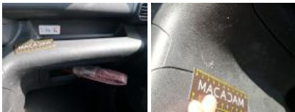
Console centrale, Griffe(s), Réparer/rempl. (montant forfaitaire)