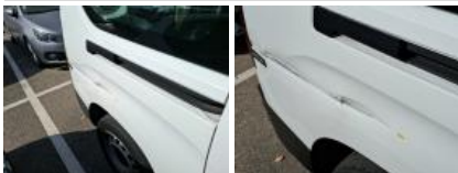
Bas de caisse ext D, Bosse(s) et griffe(s), LI - Réparer et peindre (complet)