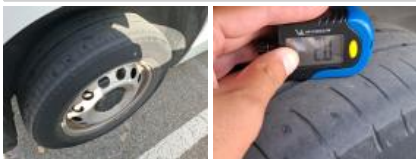
Pneu AVD, Hors tolérance, E - Remplacer