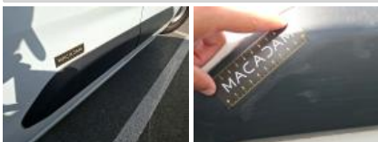
Moulure porte AVD, Griffe(s), E - Remplacer