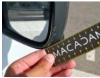
Boitier rétroviseur ext D, Griffe(s), E - Remplacer