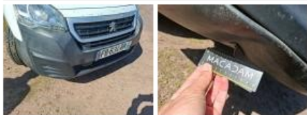
Moulure de pare-chocs AVG, Déformé / Forcé, E - Remplacer