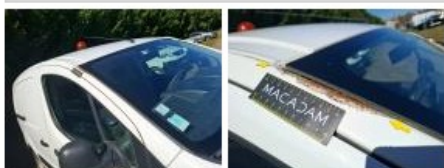
Porte AVD, Griffes(s), Peindre