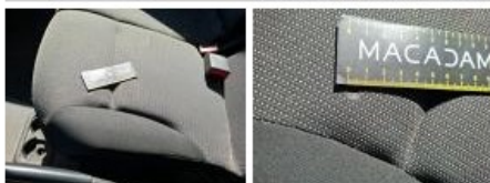
Revêtement assise siège AVD, Tache, Nettoyer