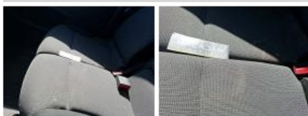
Revêtement assise siège AVG, Tache, Nettoyer