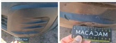
Moulure de pare-chocs AV, Griffes(s), Peindre