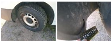
Protect. pass. roue AVD, Cassé, E - Remplacer