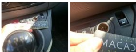
Clef de contact TC, Manque, Réparer/rempl. (montant forfaitaire)