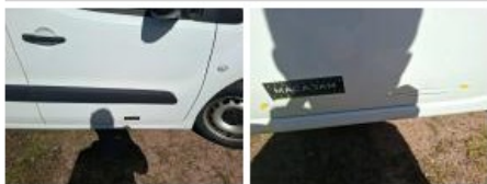
Porte coulissante D, Griffes(s), Peindre