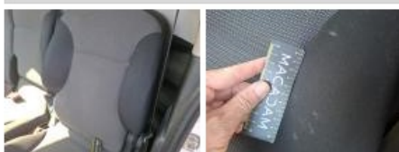
Ciel de toit, Tache, Nettoyer