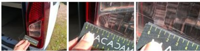
Pare-chocs AR, Déformé / Forcé, E - Remplacer