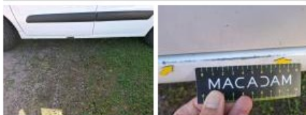
Panneau ARG, Bosse(s), Acceptable