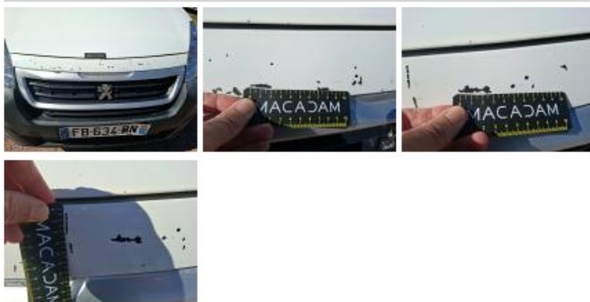
Calandre, Griffes(s), Peindre