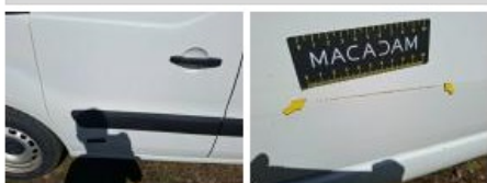
Aile AVD, Griffes(s), Peindre