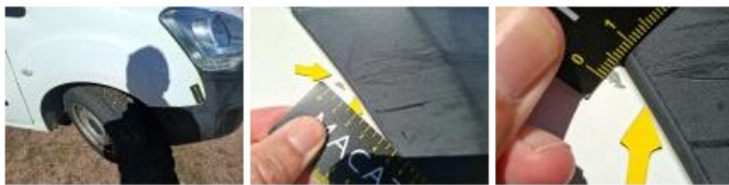
Coffre / hayon, Griffe(s), Peindre