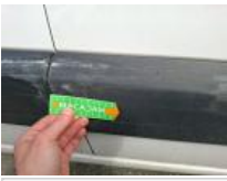
Moulure porte ARD, Griffe(s), E - Remplacer