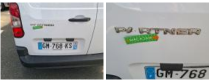
Pare-chocs AR, Griffe(s), Acceptable