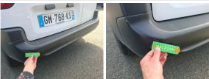
Carrosserie, Pas d'origine, Délettrage