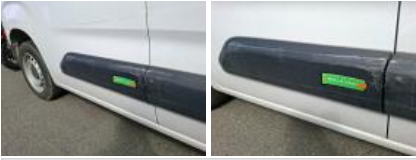
Porte coulissante D, Bosse(s) et griffe(s), LI - Réparer et peindre (complet)