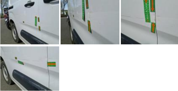
Panneau ARD, Bosse(s) et griffe(s), LI - Réparer et peindre (complet)