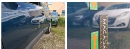
Aile ARG, Mauvaise réparation, Peindre