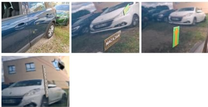
Porte AVG, Bosse(s), Acceptable