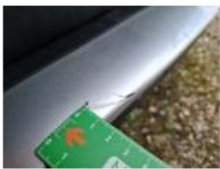
Capot, Griffe(s), Lustrage