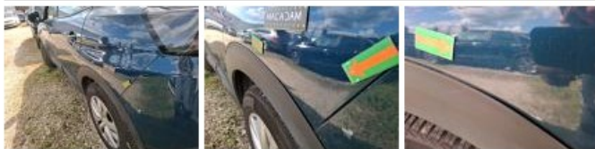
Moulure d'aile ARG, Dégrafé, Dépose/Répose