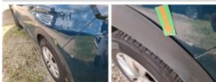
Moulure de pare-chocs AV, Griffes, Peindre