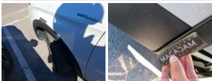
Moulure d'aile ARG, Griffe(s), Réparer/rempl. (montant forfaitaire)