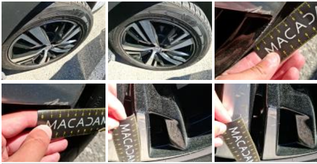
Jante alum. ARG bi-ton/polychrome, Griffe(s), Réparer/rempl. (montant forfaitaire)