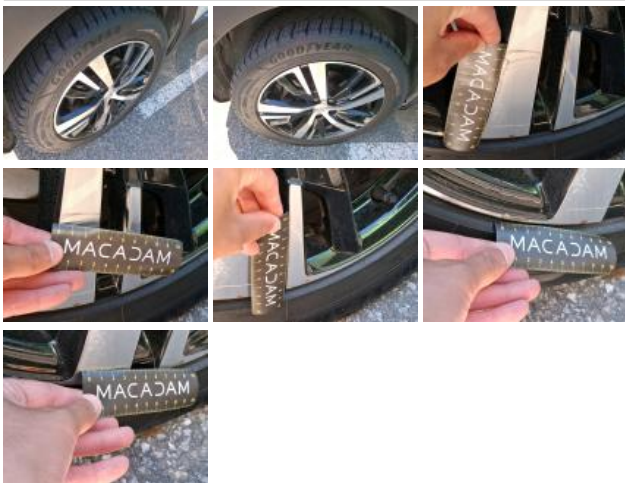
Jante alum. AVD bi-ton/polychrome, Griffe(s), Acceptable