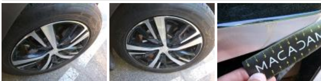
Moulure d'aile AVG, Dégrafé, Dépose/Repose