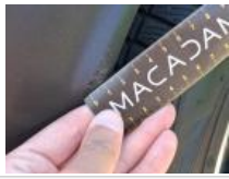
Joint de coffre/hayon, Déchirure, Acceptable