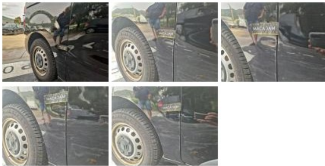
Bas de caisse ext D, Mauvaise réparation, Acceptable