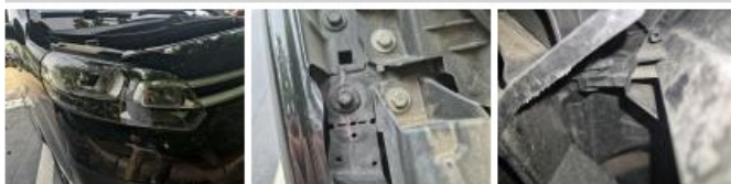
Aile AVD, Bosse(s), Acceptable