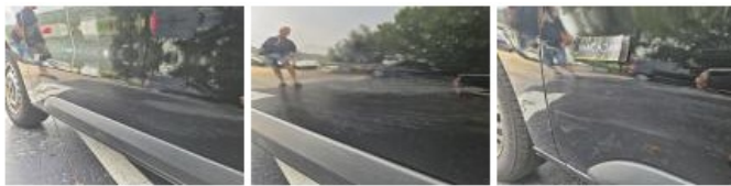
Aile ARD, Bosse(s), LI - Réparer et peindre (complet)