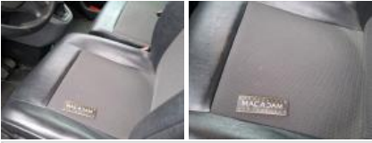
Revêtement assise siège AVD, Tache, Nettoyer