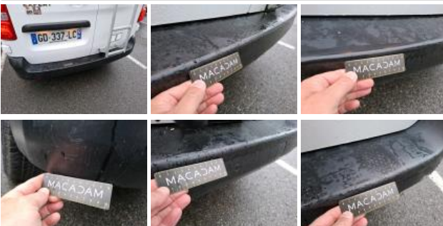
Carrosserie, Pas d'origine, Délettrage