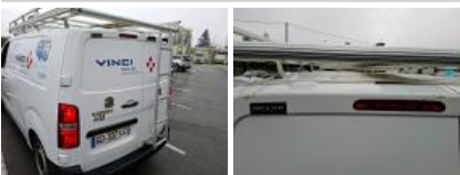
Pare-chocs AR, Griffes(s), LI - Réparer et peindre (complet)