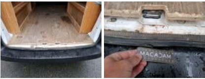
Joint de coffre/hayon, Déchirure, E - Remplacer