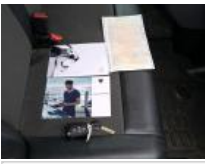
Revêtement assise siège AVG, Tache, Nettoyer