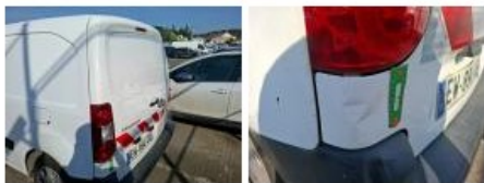
Carrosserie, Résidu de colle, Délettrage