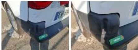
Porte de malle AR G, Bosse(s), LI - Réparer et peindre (complet)