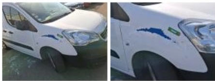
Coin pare-chocs ARG, Déformé / Forcé, LI - Réparer et peindre (complet)