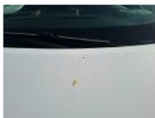
Panneau ARD, Bosse(s), LI - Réparer et peindre (complet)