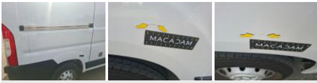
Base rétroviseur ext D, Griffe(s), Acceptable