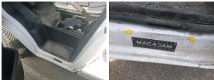
Garniture intérieur, Cassé, E - Remplacer