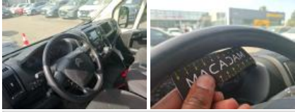
Joint de porte AVG, Déchirure, E - Remplacer