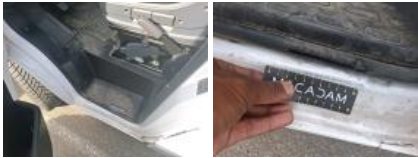
Bas de caisse int AVG, Griffe(s), Peindre