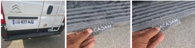
Porte de malle AR G, Bosse(s) et griffe(s), Acceptable