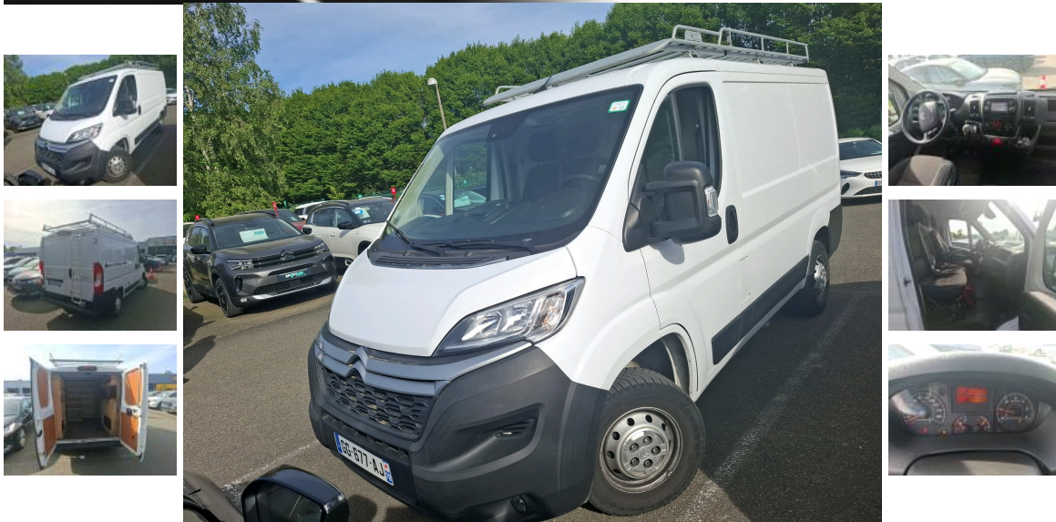
CITROEN Jumper Tole 30 L1H1 BlueHDI 12: GG-677-AJ