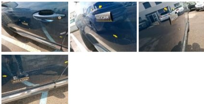
Porte ARG, Bosse(s) et griffe(s), LI - Réparer et peindre (complet)