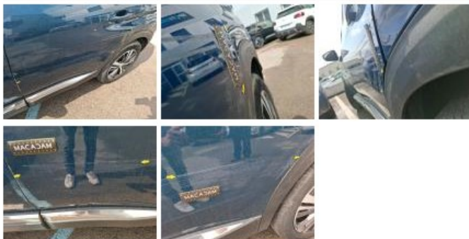
Aile ARG, Bosse(s) et griffe(s), Le - Remplacer et peindre