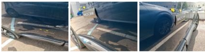
Garnit. couvercle AR, Griffe(s), Réparer/rempl. (montant forfaitaire)