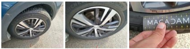
Moulure d'aile AVG, Griffe(s), Réparer/rempl. (montant forfaitaire)