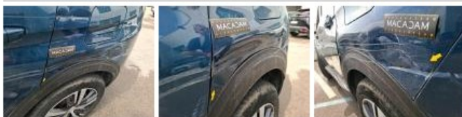
Moulure d'aile ARG, Déformé / Forcé, E - Remplacer