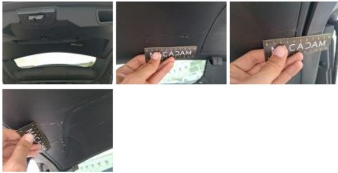
Garnit. int G coffre, Griffe(s), Réparer/rempl. (montant forfaitaire)