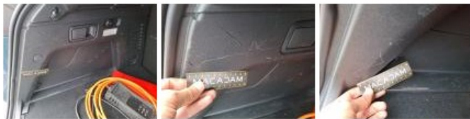
Garnit. int D coffre, Griffe(s), Réparer/rempl. (montant forfaitaire)