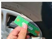
Enjoliveur de roue ARG, Déformé / Forcé, E - Remplacer