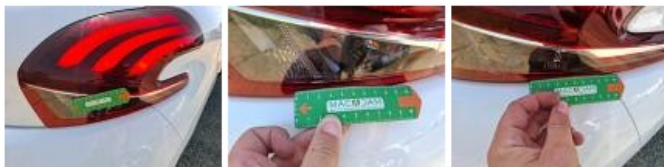
Carrosserie, Pas d'origine, Acceptable