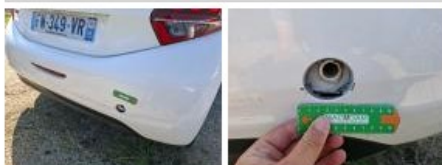
Feu ARD, Fêlure, E - Remplacer