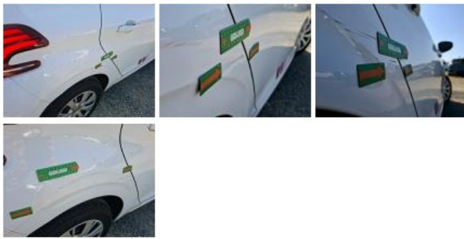
Porte ARD, Bosse(s), LI - Réparer et peindre (complet)