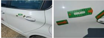
Poignée ext porte ARG, Griffe(s), Peindre