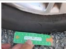
Enjoliveur de roue AVD, Déformé / Forcé, E - Remplacer