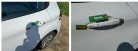
Aile ARG, Griffe(s), Lustrage