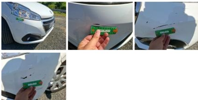
Optique AVG, Griffe(s), E - Remplacer