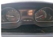
Voyant défaut, Allumé, Contrôler