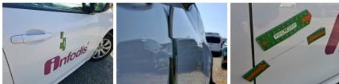
Boitier rétroviseur ext D, Griffe(s), Acceptable