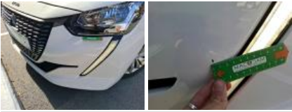
Aile ARD, Bosse(s), LI - Réparer et peindre (complet)