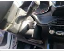
Intérieur, Tache, Nettoyer