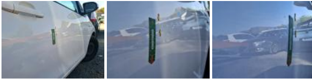
Aile ARD 3P, Mauvaise réparation, Peindre