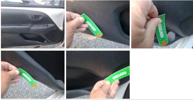
Porte AVD, Bosse(s), LI - Réparer et peindre (complet)