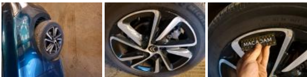
Jante alum. ARD bi-ton/polychrome, Griffe(s), Réparer/rempl. (montant forfaitaire)