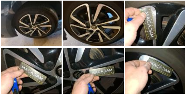
Jante alum. ARG bi-ton/polychrome, Griffe(s), Réparer/rempl. (montant forfaitaire)