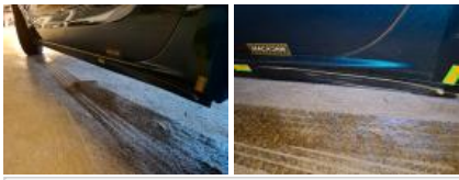
Porte ARG, Bosse(s), LI - Réparer et peindre (complet)