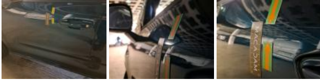
Aile AVG, Bosse(s) et griffe(s), LI - Réparer et peindre (complet)