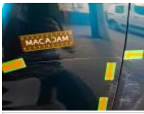
Aile AVD, Bosse(s) et griffe(s), LI - Réparer et peindre (complet)