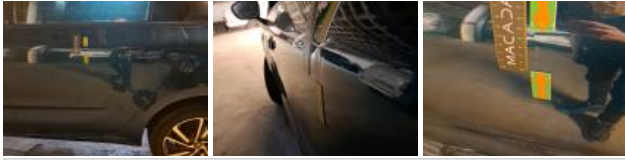
Porte AVG, Bosse(s), LI - Réparer et peindre (complet)