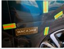
Répétiteur D, Griffe(s), E - Remplacer