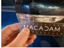
Boîtier rétroviseur ext D, Griffe(s), Peindre