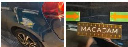
Bas de caisse ext G, Bosse(s) et griffe(s), LI - Réparer et peindre (complet)