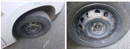
Pneu ARD, Hors tolérance, E - Remplacer