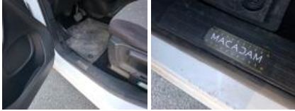
Garniture intérieur, Manque, E - Remplacer