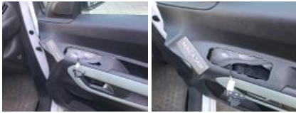
Accoudoir AV C, Manque, E - Remplacer