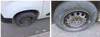
Enjoliveur de roue AVD, Manque, E - Remplacer