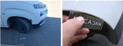
Bas de caisse ext D, Bosse(s), LI - Réparer et peindre (complet)