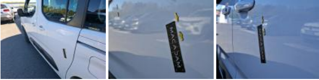
Pare-chocs AV, Griffe(s), Acceptable