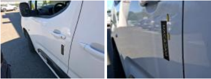
Porte coulissante G, Bosse(s), Acceptable