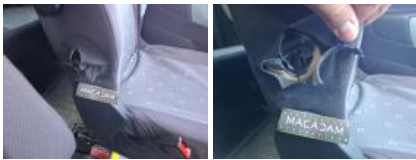
Revêtement dossier AVD, Déchirure, Réparer/rempl. (montant forfaitaire)