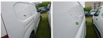
Porte coulissante D, Bosse(s) et griffe(s), LI - Réparer et peindre (complet)