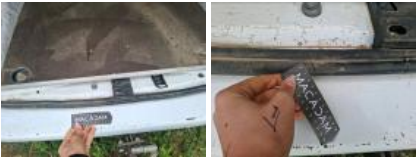
Trappe à essence, Griffe(s), Peindre