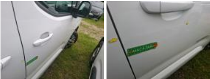
Boitier rétroviseur ext D, Griffe(s), Lustrage