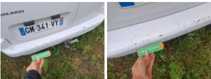
Coin pare-chocs ARG, Déformé / Forcé, LI - Réparer et peindre (complet)