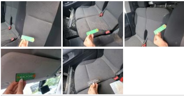
Revêtement assise siège AVG, Brûlé, E - Remplacer