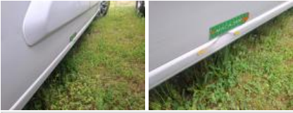
Moulure porte AVD, Griffe(s), Peindre