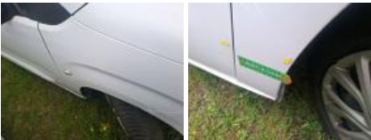
Pare-chocs AR, Griffe(s), Peindre