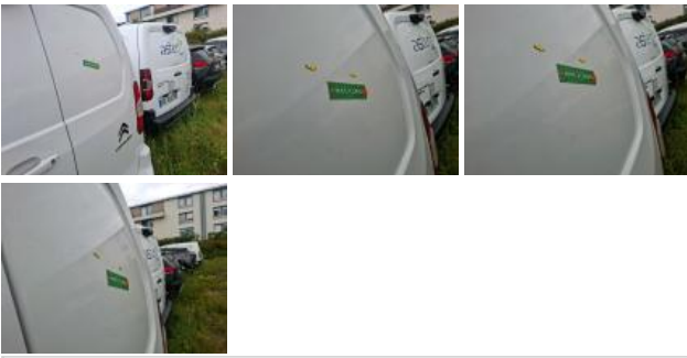
Coin pare-chocs ARD, Griffe(s), Acceptable