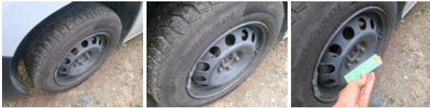
Enjoliveur de roue ARD, Manqué, E - Remplacer