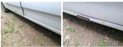
Panneau Latéral G, Bosse(s) et griffe(s), LI - Réparer et peindre (complet)