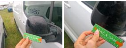
Aile AVD, Griffe(s), Peindre