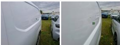
Moulure d'aile ARG, Griffe(s), Lustrage