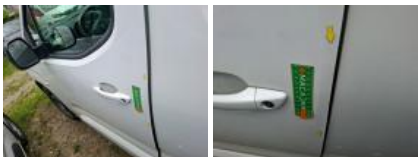
Bas de caisse ext G, Griffe(s), Peindre