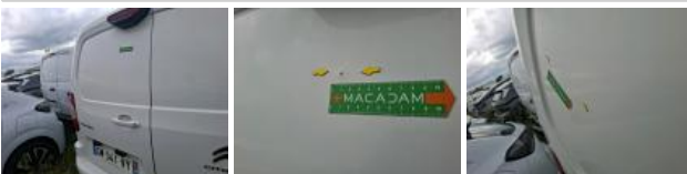
Porte de malle AR D, Bosse(s) et griffe(s), LI - Réparer et peindre (complet)