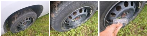
Enjoliveur de roue AVD, Cassé, E - Remplacer