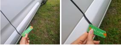
Porte AVD, Griffe(s), Peindre