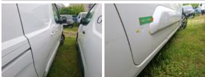
Moulure porte ARD, Griffe(s), Lustrage