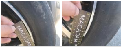
Pneu AVD, Déchirure, E - Remplacer