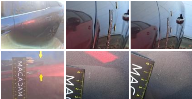
Aile ARD, Griffe(s), Peindre