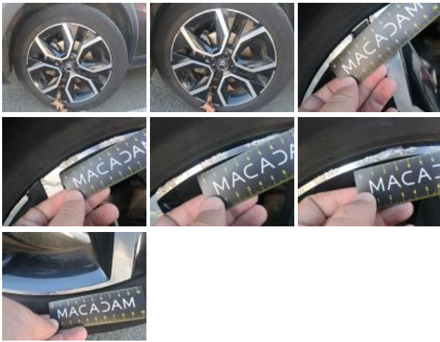
Pneu ARG, Déchirure, E - Remplacer