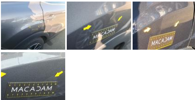
Porte ARD, Bosse(s) et griffe(s), LI - Réparer et peindre (complet)