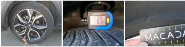
Jante alum. AVG bi-ton/polychrome, Griffes, Réparer/rempl. (montant forfaitaire)