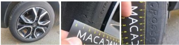
Jante alum. ARD bi-ton/polychrome, Griffes, Réparer/rempl. (montant forfaitaire)