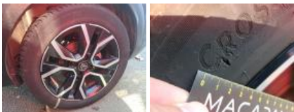
Pneu ARD, Déchirure, E - Remplacer