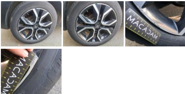
Jante alum. AVD bi-ton/polychrome, Griffes, Réparer/rempl. (montant forfaitaire)