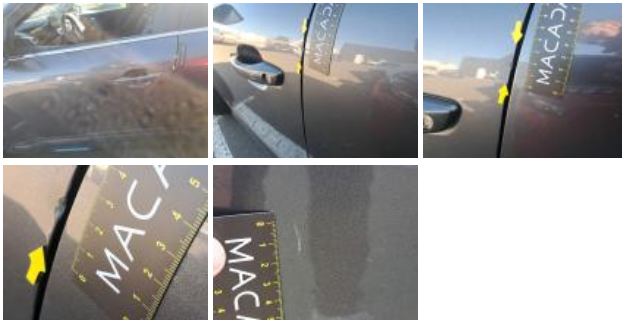
Porte ARG, Bosse(s) et griffe(s), LI - Réparer et peindre (complet)