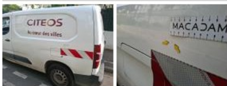
Pare-chocs AV, Griffe(s), Acceptable