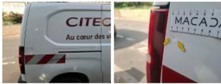
Moulure porte AVD, Griffe(s), Réparer/rempl. (montant forfaitaire)