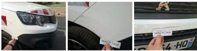
Panneau ARD, Bosse(s) et griffe(s), Acceptable