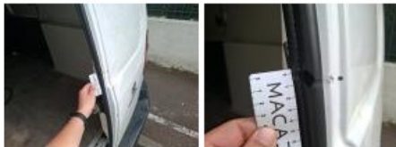
Porte de malle AR D, Bosse(s) et griffe(s), LI - Réparer et peindre (complet)