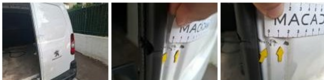
Porte de malle AR G, Bosse(s) et griffe(s), Acceptable