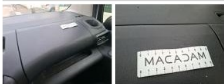
Placage planche de bord, Trou, Forfait