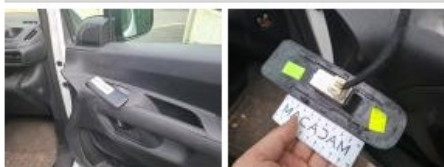
Panneau ARG, Bosse(s), Acceptable