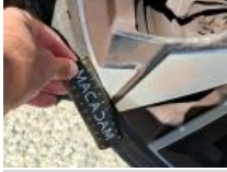
Jante alum. ARG bi-ton/polychrome, Griffe(s), Acceptable