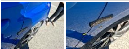
Aile ARD, Bosse(s), LI - Réparer et peindre (complet)