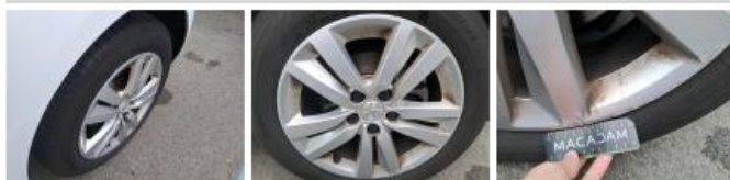
Jante alum. ARD, Griffe(s), Acceptable