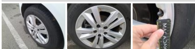
Jante alum. AVD, Griffe(s), Réparer/rempl. (montant forfaitaire)