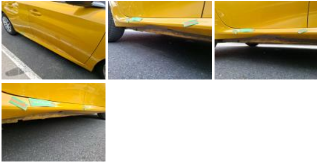
Aile AVD, Bosse(s), LI - Réparer et peindre (complet)