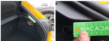
Garnit. int D coffre, Manque, E - Remplacer