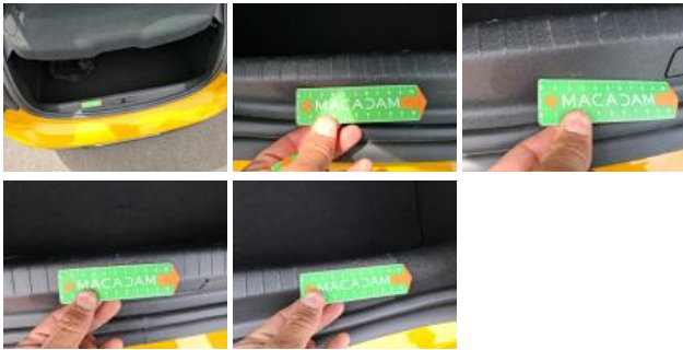
Garnit. int D coffre, Griffe(s), Acceptable