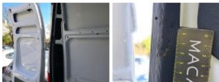
Porte de malle AR G, Bosse(s) et griffe(s), LI - Réparer et peindre (complet)