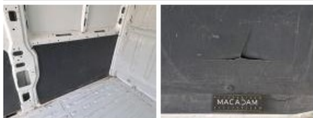
Garnit. int D coffre, Cassé, E - Remplacer