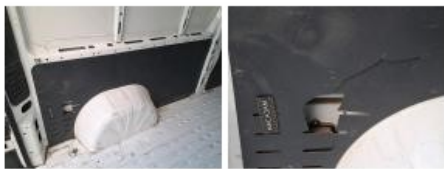
Garnit. int G coffre, Cassé, E - Remplacer