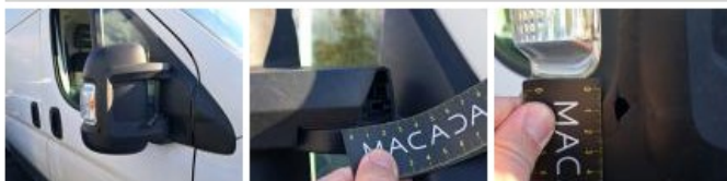
Répétiteur D, Fêlure, E - Remplacer