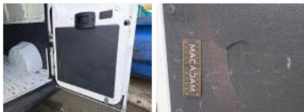
Passage de roue ARD, Bosse(s), Réparer/rempl. (montant forfaitaire)