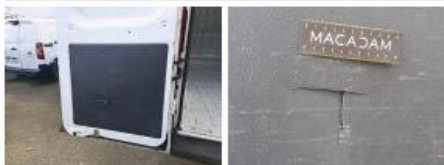
Garniture porte de malle ARD, Cassé, E - Remplacer