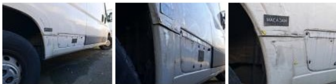
Moulure d'aile ARD, Manque, E - Remplacer