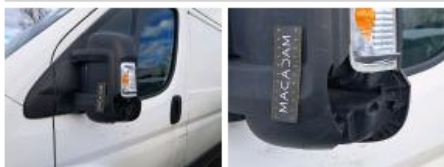
Répétiteur G, Cassé, E - Remplacer