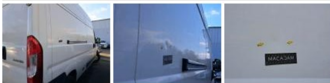
Bas de caisse ext D, Bosse(s) et griffe(s), LI - Réparer et peindre (complet)