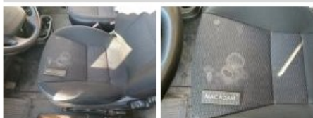
Revêtement assise siège AVD, Tache, Nettoyer