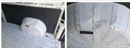
Passage de roue ARG, Bosse(s), Réparer/rempl. (montant forfaitaire)