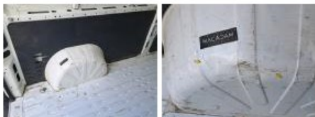
Garnit. int G coffre, Cassé, E - Remplacer