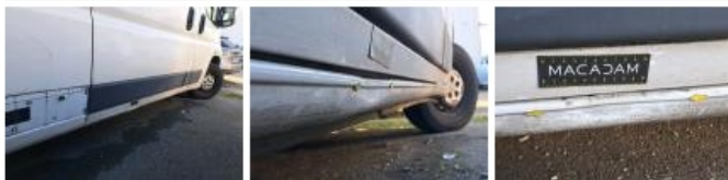
Porte coulissante D, Griffe(s), Peindre