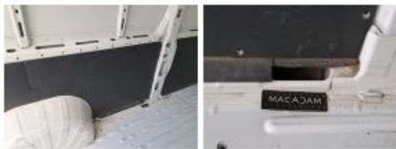
Garnit. int G coffre, Cassé, E - Remplacer