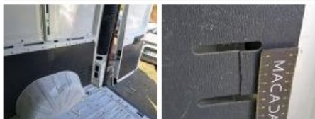
Garnit. int D coffre, Cassé, E - Remplacer