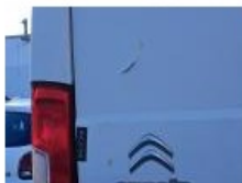
Porte de malle AR D, Bosse(s), LI - Réparer et peindre (complet)