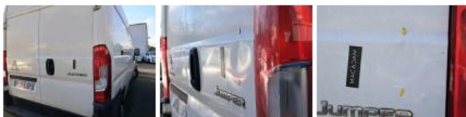
Feu ARD, Cassé, E - Remplacer