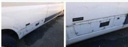
Bas de caisse ext D, Bosse(s) et griffe(s), LI - Réparer et peindre (complet)