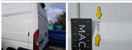
Panneau ARD, Bosse(s), LI - Réparer et peindre (complet)