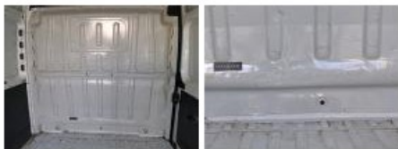
Plancher AR, Rouille, Peindre