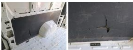
Cloison, Bosse(s), Réparer/rempl. (montant forfaitaire)