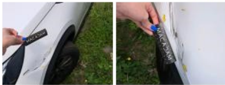
Porte ARD, Griffe(s), Peindre