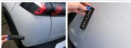
Moulure de pare-chocs AR, Griffe(s), Peindre