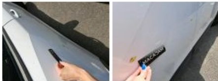
Porte AVD, Griffe(s), Peindre