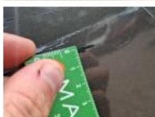
Carosserie, Grêle, Forfait grêle (forte)