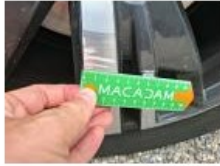
Boitier rétroviseur ext G, Griffe(s), Lustrage