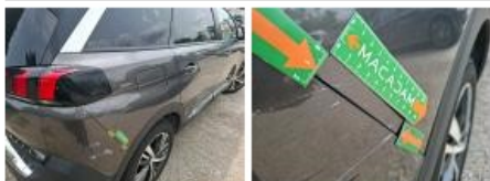
Coin pare-chocs ARD, Griffe(s), Peindre