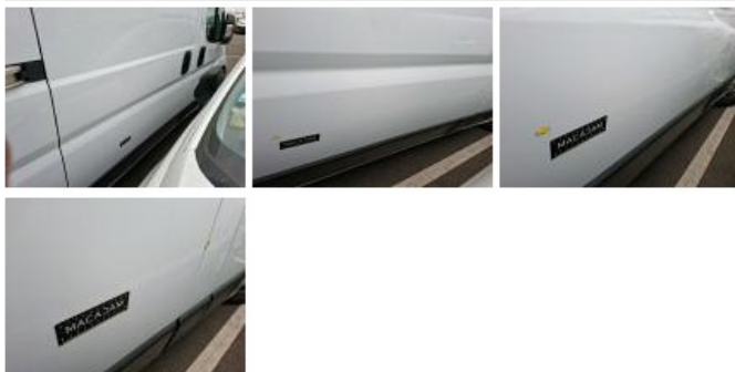
Montant milieu D, Griffe(s), Peindre