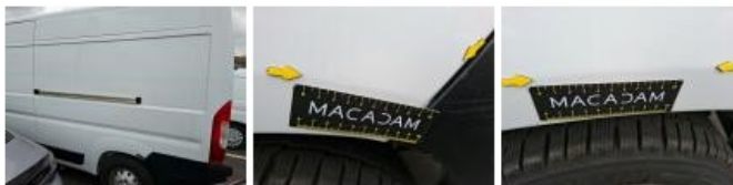
Moulure d'aile ARG, Griffe(s), Acceptable