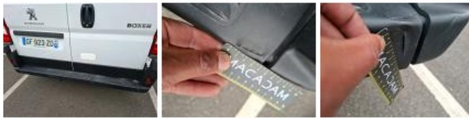
Capteur de parking AR, Cassé, E - Remplacer