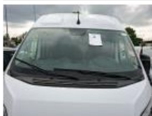
Pare-brise, Eclat(s), E - Remplacer