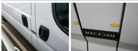
Porte AVD, Griffe(s), Peindre