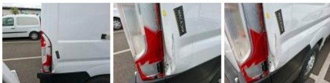
Panneau ARD, Bosse(s) et griffe(s), LI - Réparer et peindre (complet)