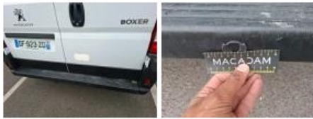
Capteur de parking AR, Dégrafé, Dépose/Répose