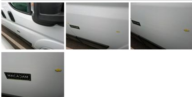
Base rétroviseur ext D, Griffe(s), LI - Réparer et peindre (complet)