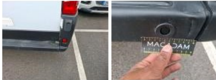
Coin pare-chocs ARD, Déformé / Forcé, Réparer/rempl. (montant forfaitaire)