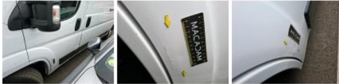
Base rétroviseur ext G, Griffe(s), LI - Réparer et peindre (complet)