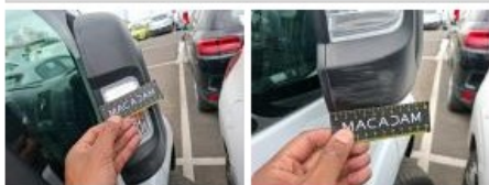
Aile AVD, Griffe(s), Lustrage