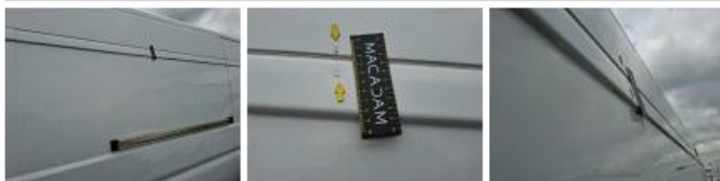
Porte coulissante D, Griffe(s), Peindre