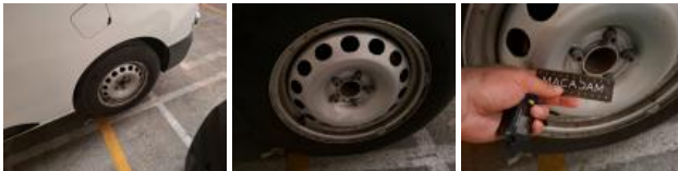
Enjoliveur de roue ARD, Manque, E - Remplacer