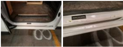
Bas de caisse int AVD, Bosse(s), LI - Réparer et peindre (complet)