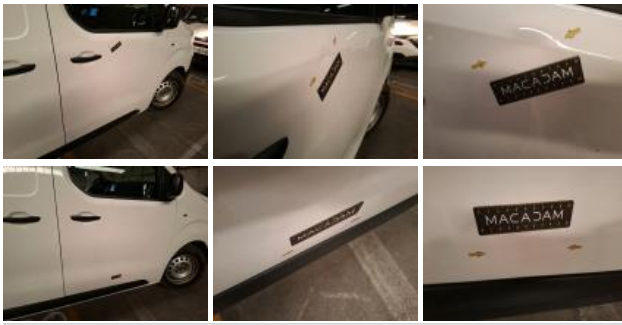
Aile AVD, Bosse(s), LI - Réparer et peindre (complet)