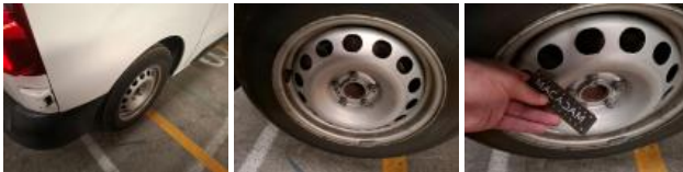
Enjoliveur de roue AVD, Manque, E - Remplacer