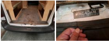
Carrosserie, Pas d'origine, Délettrage