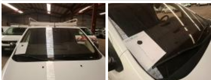
Kit collage vitrage, Nécessaire repose vitrage, Réparer/rempl. (montant forfaitaire)