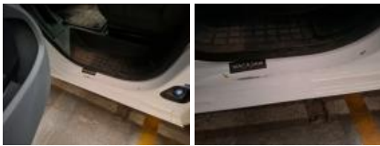
Bas de caisse int ARD, Bosse(s) et griffe(s), LI - Réparer et peindre (complet)