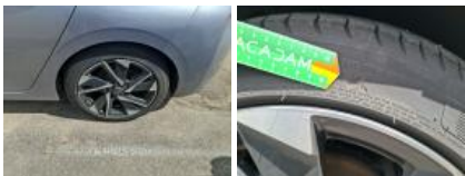
Jante alum. ARG bi-ton/polychrome, Griffe(s), Acceptable