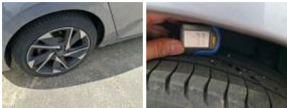
Pneu ARG, Déchirure, E - Remplacer