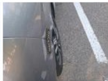
Jupe AR, Griffes(s), Peindre