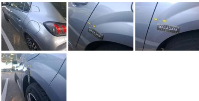
Aile ARD, Bosse(s) et griffe(s), LI - Réparer et peindre (complet)