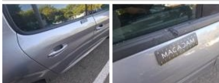
Joint de porte AVD, Déchirure, E - Remplacer