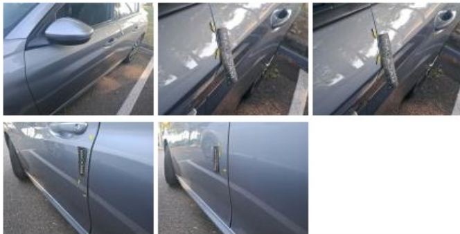
Porte ARG, Bosse(s) et griffe(s), Acceptable