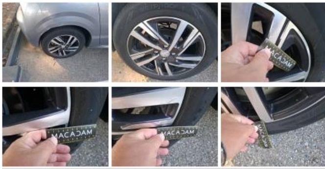
Jante alum. AVD bi-ton/polychrome, Griffe(s), E - Remplacer