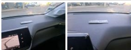
Vide-poches, Cassé, E - Remplacer