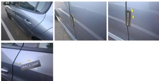
Aile ARG, Bosse(s), Acceptable