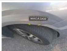
Pare-chocs AR, Déformé / Forcé, LI - Réparer et peindre (complet)