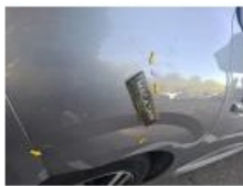
Porte ARD, Bosse(s) et griffe(s), LI - Réparer et peindre (complet)