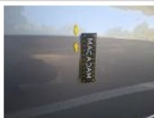
Aile AVD, Bosse(s), LI - Réparer et peindre (complet)